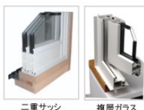
二重サッシ 複層ガラス