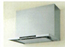
●新洗エールレンジフード