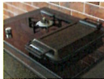
●ハイブリッドコンロ