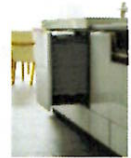
●ノックオープン機能付き