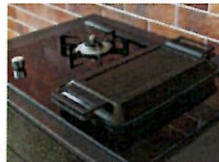
●ハイブリッドコンロ