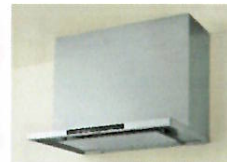
●新洗エールレンジフード